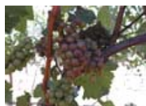
Wein- u. Obstbau