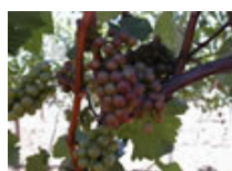
Wein- u Obstbau